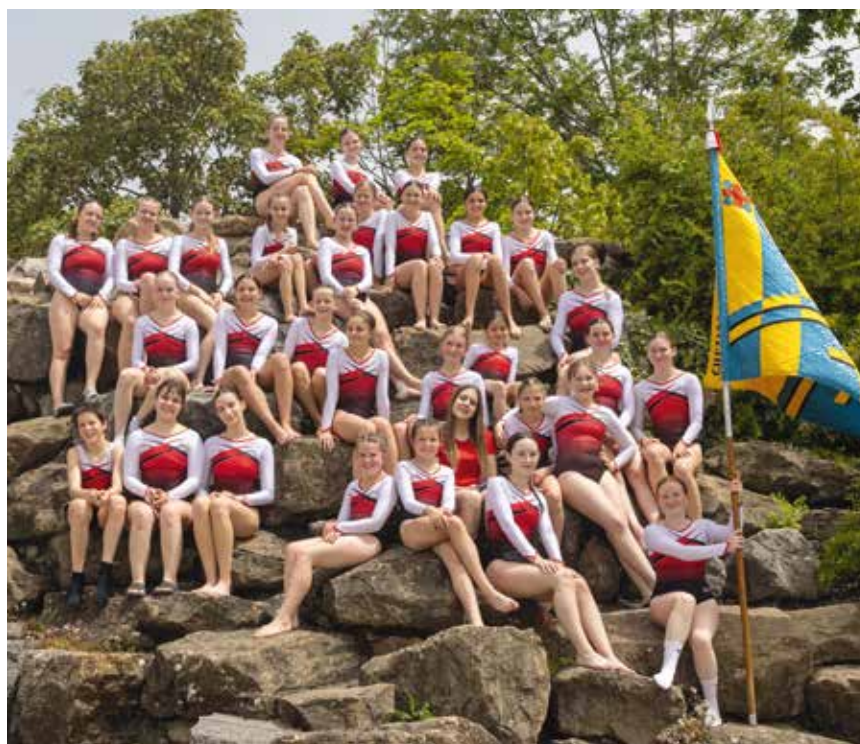
Le groupe jeunesse de la Gym Chézard-Saint-Martin en évidence à la Fête romande (photo Gym Chézard).

Le groupe jeunesse de la Gym Chézard-Saint-Martin a encore glané l'or dans la combinaison d'engins.