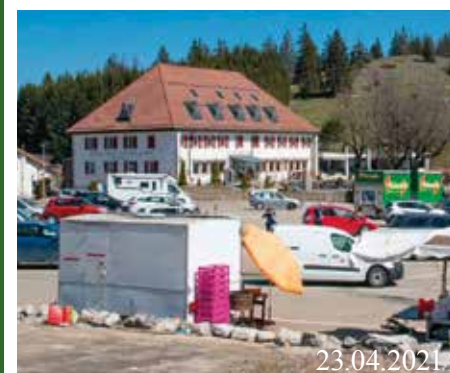
La Vue-des-Alpes.