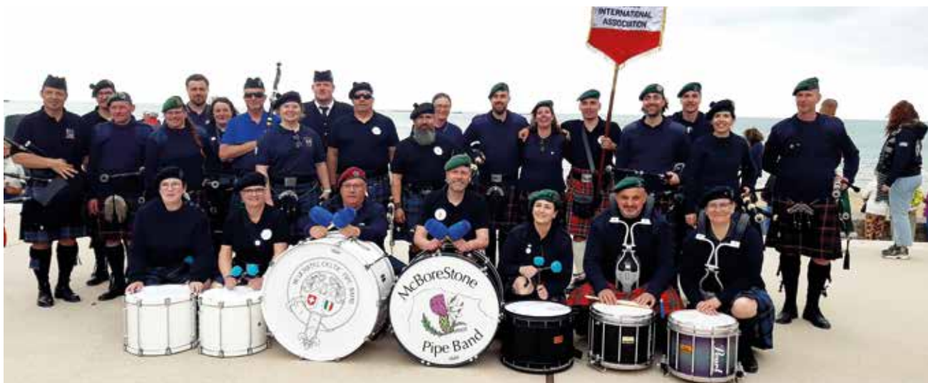
Les membres du Neuchâtel Celtic Pipe Band.

Le groupe du Neuchâtel Celtic Pipe Band était sur la plage de Sword Beach le 6 juin dernier pour participer aux commémorations du 80 e anniversaire du débarquement. Un moment suspendu dans le temps. Solennel.