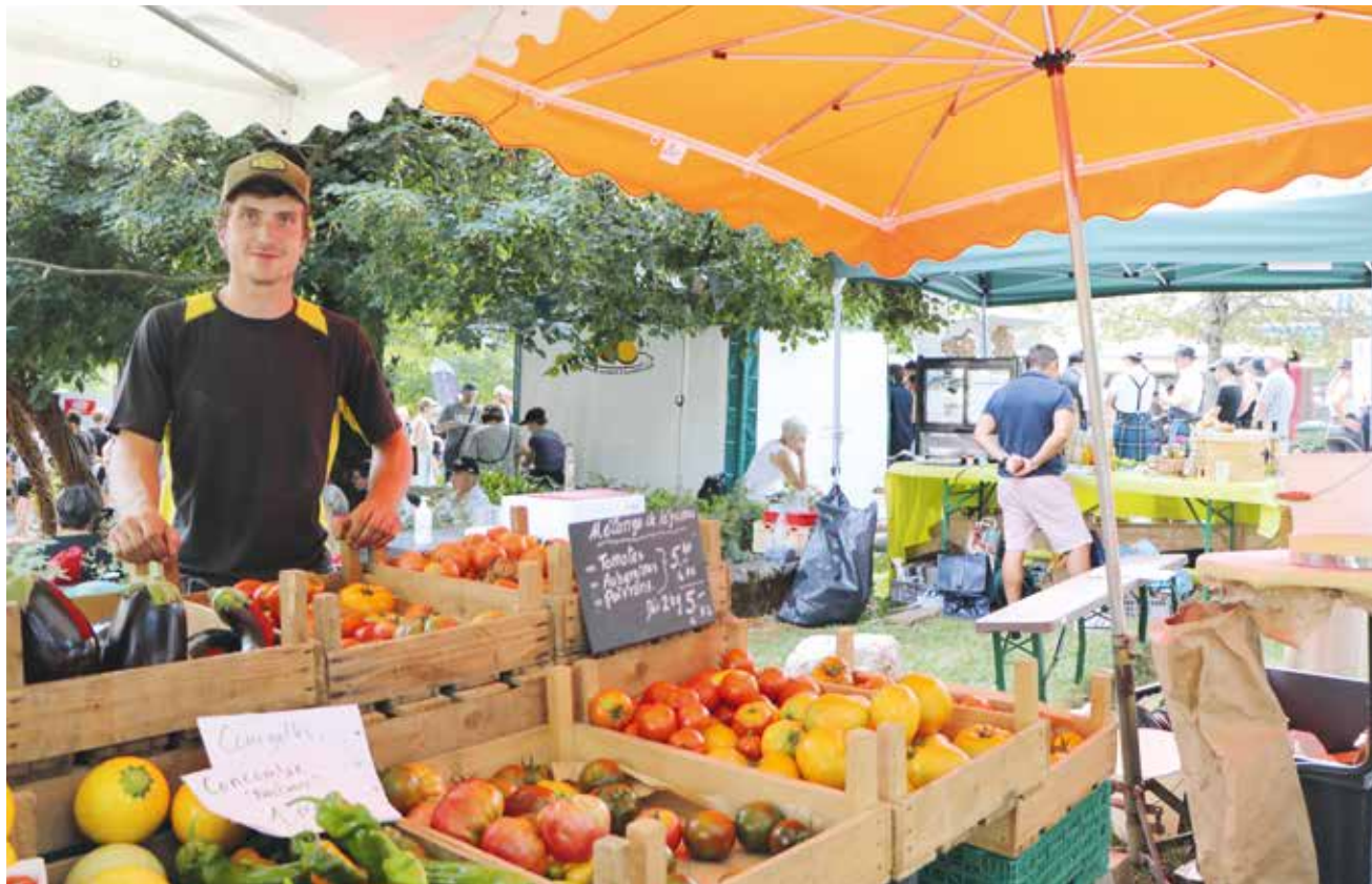
Les producteurs de la région seront évidemment présents à Fête la Terre.

Si vous désirez nous faire part d'un événement qui se déroule au Val-de-Ruz, faites-nous parvenir vos informations détaillées par courriel à l'adresse redaction@valderuzinfo.ch . Le délai d'envoi des textes pour notre première édition, après les vacances estivales, (numéro 304 du 15 août) est fixé au mardi 6 août . Le libellé de l'annonce est du ressort de la rédaction. Les lotos, matches aux cartes, cours privés, ne sont pas référencés dans l'agenda. Pour ce genre de manifestation, il faut se référer à la rubrique petites annonces sur www.valderuzinfo.ch .