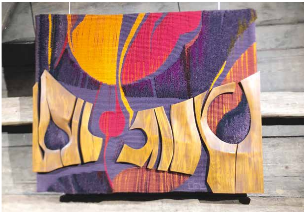
Une tapisserie de l'artiste.